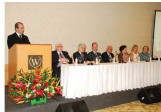
Mesa de abertura do Infecto Rio 2012