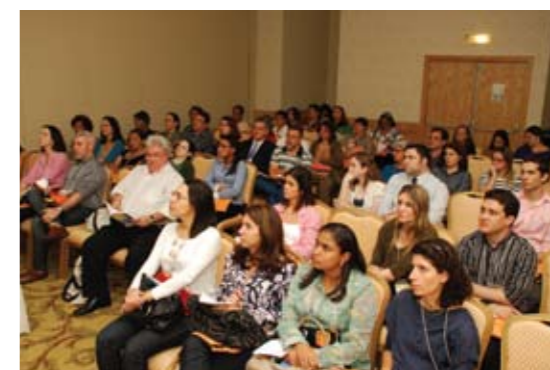
Infectologistas do Rio de Janeiro e de outros Estados prestigiam o congresso