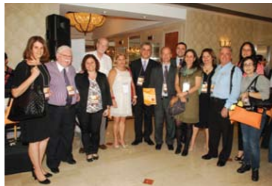
Diretoria da SIERJ e convidados no lançamento do livro